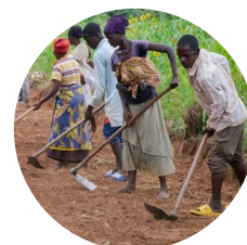
Cash for work