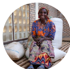
Construction de hangars