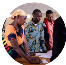
Formation et soutien aux coopératives et AVEC