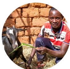
Soutien aux éleveurs